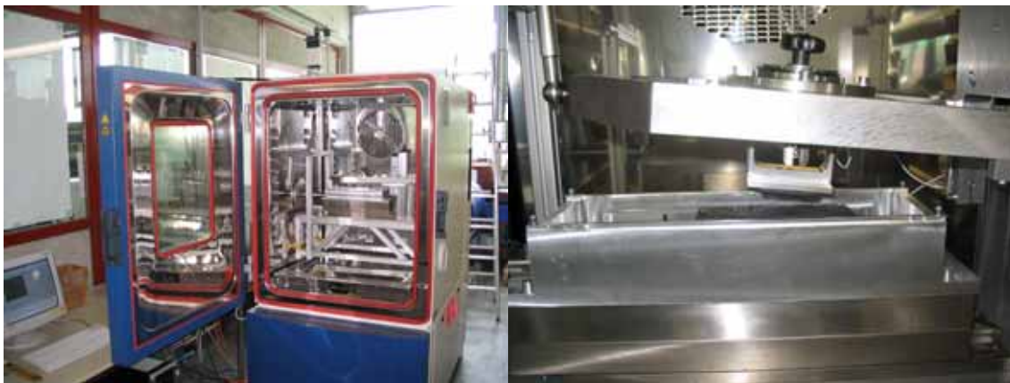
Abbildung 3: Linear-Tribometer im Temperierschrank (-40°C bis 100°C). Der Antrieb ist extern angebracht (links). Die Aufnahme der Reiboberfläche ist flexibel und lässt unterschiedliche Geometrien zu (rechts).

Das Linear-Tribometer ermöglicht Reibexperimente in weiten Temperaturbereichen (-40 bis 100°C), bei hohen Drücken (bis zu 2,5 MPa) und breitem Geschwindigkeitsbereich von 0,005 bis 300 mm/s. Als Probe werden Gummiplatten mit den Maßen 50*50*2 mm 3 benutzt. Die Aufnahme der Reibfläche kann verschiedene Geometrien fassen, so dass sowohl Experimente auf rauen Asphaltoberflächen wie auch auf Stahlrohren durchgeführt werden können. Im Gegensatz zur Reibmessung an der Zwick Zugmaschine oder mit dem MTS-Hydropulser wird beim Linear-Tribometer die Probe festgehalten und die Reibfläche unter der Probe hinweg bewegt. Die Normalkraft wird über Gewichte auf den Hebelarm der Probe aufgebracht (Abbildung 3).