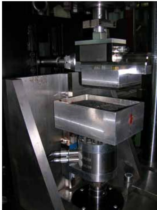
Abbildung 2: Einrichtung zur Durchführung stationärer und instationärer Reibmessungen am biaxialen MTS-Hydropulser

Als Alternative zur Untersuchung dynamischen Reibvorgänge bietet sich ein modifizierte biaxiale Hydropulser der Firma MTS an. Dies ermöglicht eine hohe zeitaufgelöste Bestimmung von Reib- und Normalkraft bei unterschiedlichen Druck-Geschwindigkeitsverläufen. Der Kraftbereich beträgt 100 - 10.000 N und der Geschwindigkeitsbereich liegt bei 0,1 - 500 mm/s, wobei beliebige Druck- und Geschwindigkeitsverläufe mittels eines Funktionsgenerators vorgegeben werden können. Es können Messungen auf Stahl- oder Asphaltoberfläche mit und ohne Lubrikant durchgeführt werden. Als Probe werden Gummiplatten mit den Maßen 80*80*6 mm 3 benutzt. In Abbildung 2 ist der Aufbau der Reibapparatur mit dem biaxialen Hydropulser dargestellt.